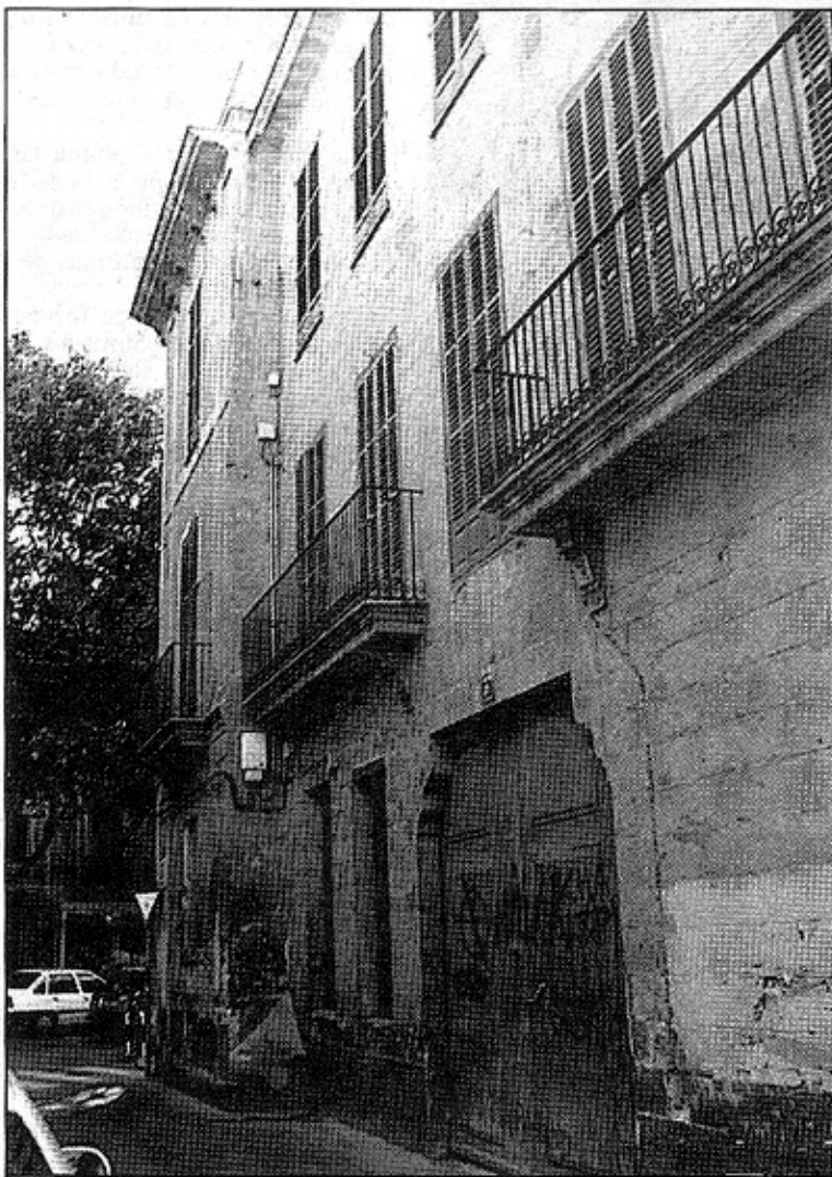
El edificio que hace esquina con La Rambla y Calle Real se rehabilita.

Se combinan rehabilitación y nueva edificación