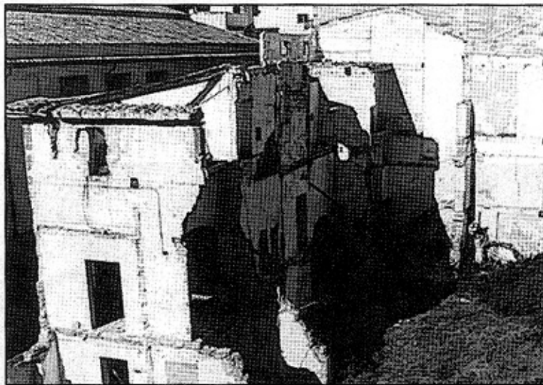
Aquí se ubicará la nueva edificación respetando las fachadas.

que una circulación bordeando el patio, vacío hacia el que tienden todas las dependencias y actividades de la sede del colegio. Son importantes los accesos al conjunto a edificar. Se disponen el de la Rambla y el de la calle Teresas a través de la tapia y el patio.