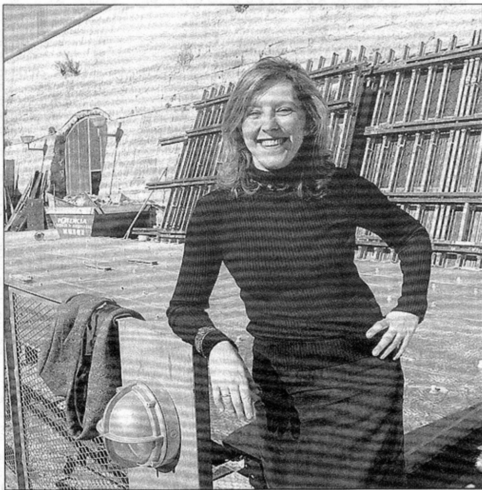
Pérez-Jofre ha coordinat exposicions del Reina Sofia, dirigit el departament didàctic del Thyssen-Bornemisza i ha estat subdirectora d'activitats museístiques del Guggenheim.

—És una mica prest. Durant el primer any ens dedicarem a donar a conèixer en profunditat les col·leccions de fons sobre el qual neix. Després començaran les temporals. Pens que hi ha obres de les